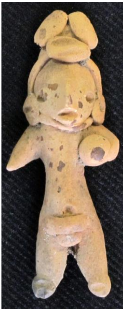
5. Figurilla de jugador de pelota proveniente de La Laguna.