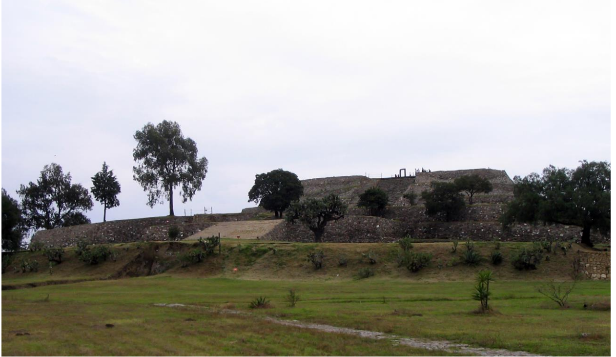
4. Edificio de las Flores de Xochitécatl.