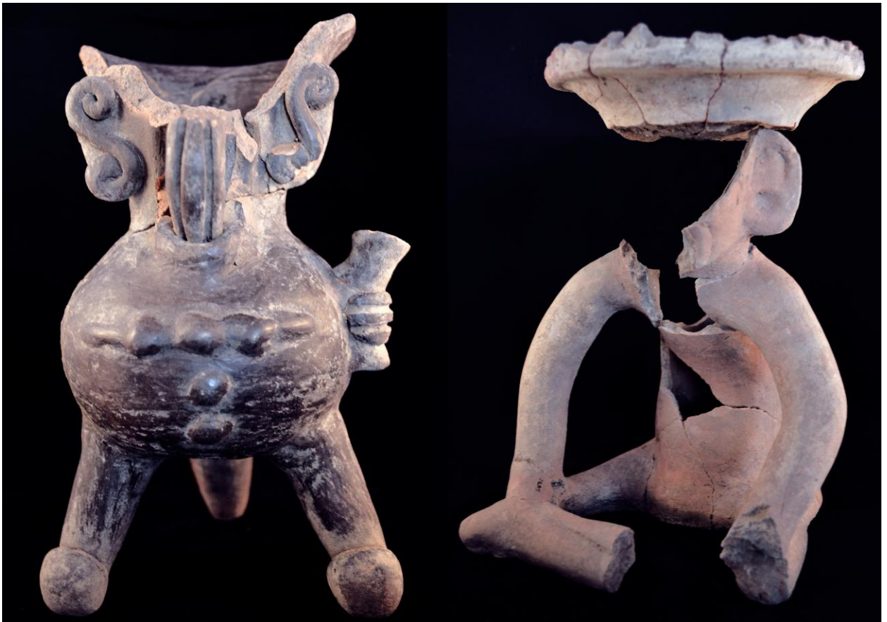
7. Vasijas efigie provenientes de la Estructura 12M-3 de La Laguna: (izquierda) Dios Tormenta, (derecha) Dios Viejo del Fuego.