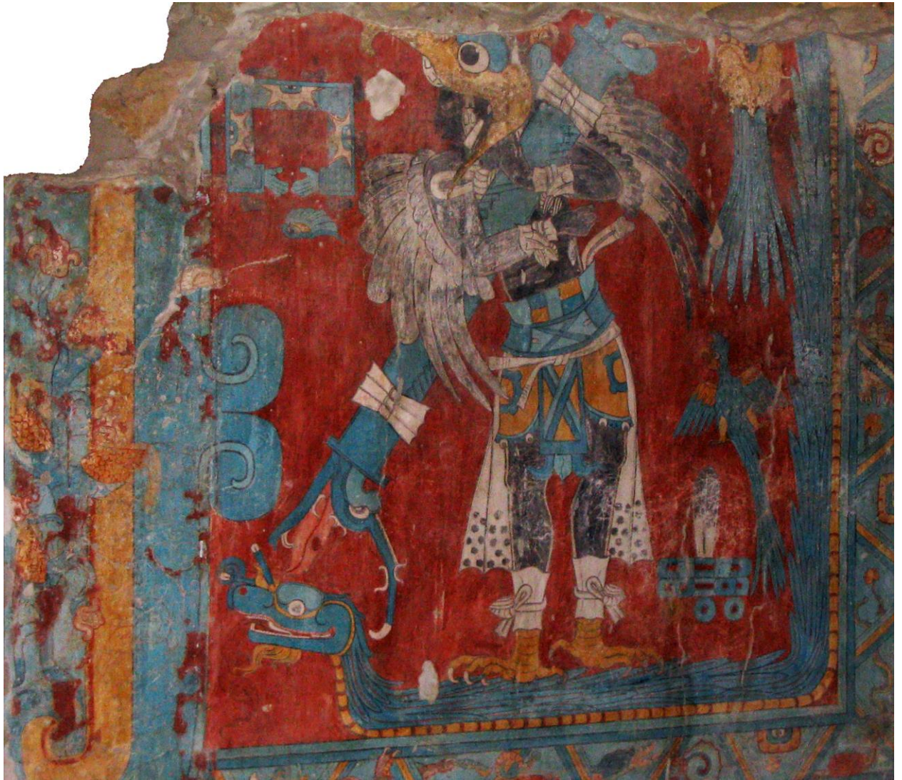
11. Mural del Edificio A de Cacaxtla con una representación de un hombre vestido de águila sobre Quetzalcoatl.