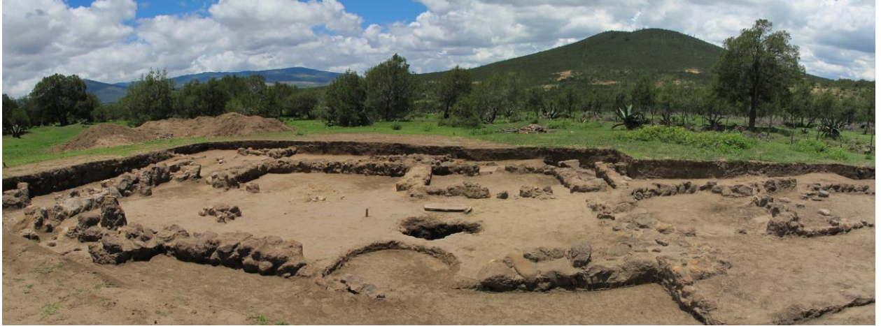
6. Estructura 12M-3 de La Laguna.