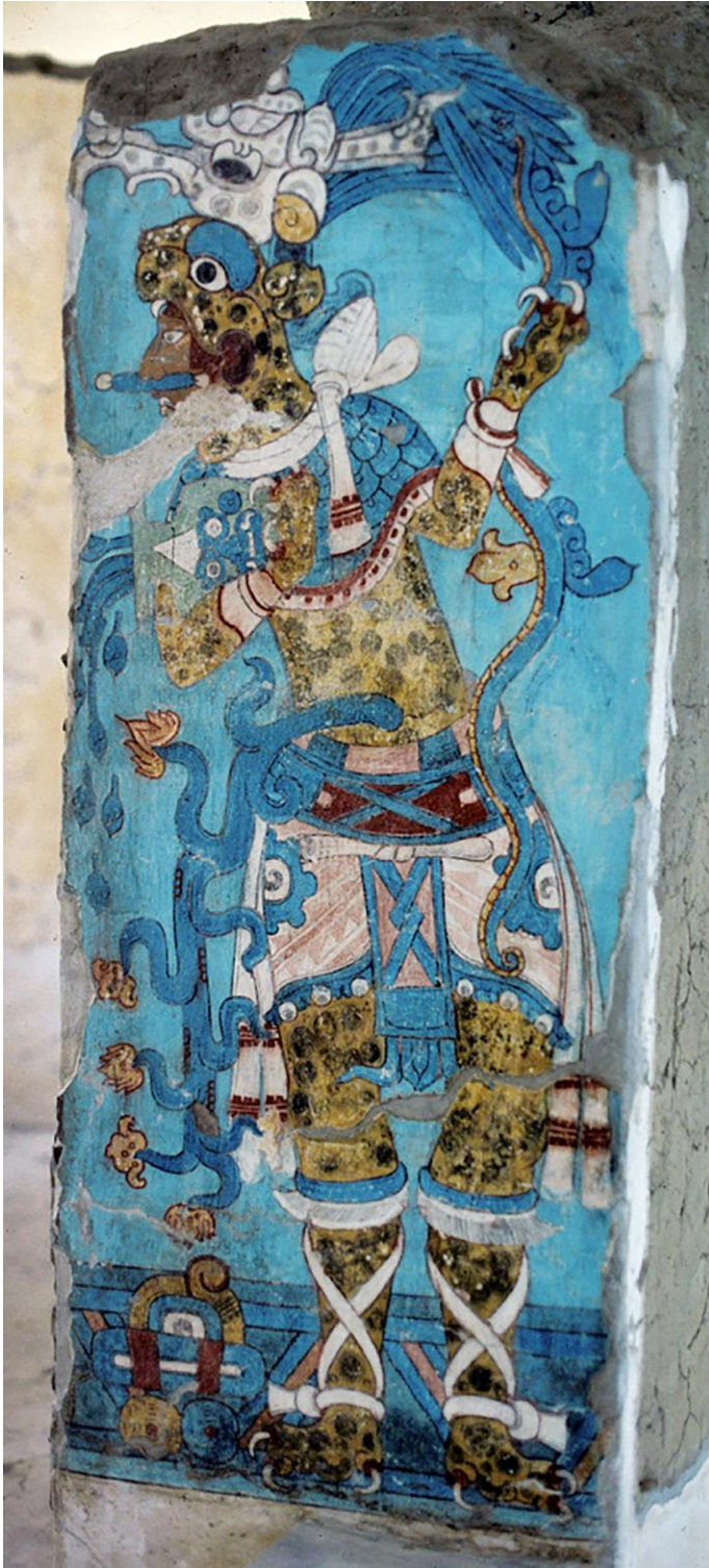
10. Mural del Edificio A de Cacaxtla con una representación de un hombre vestido de jaguar derramando agua de una vasija Tlaloc.