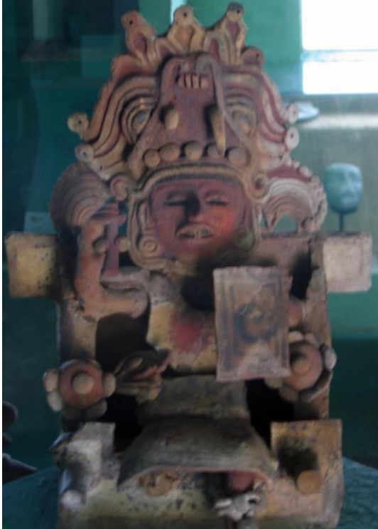
12. Figura de cerámica proveniente de Xochitécatl, fechando al Epiclásico, con una representación de una mujer ricamente ataviada y sentada sobre un trono.