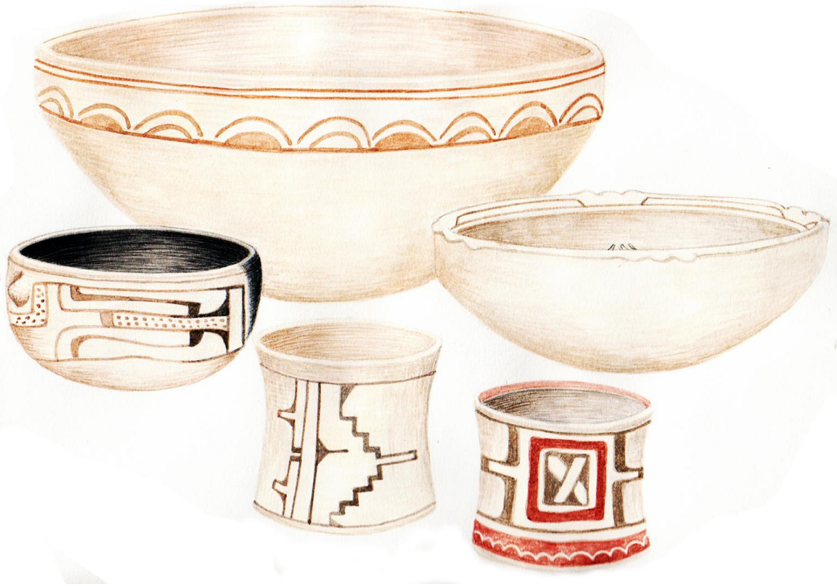
2. Cerámica blanca del Preclásico Medio provenientes del sitio Amomoloc. (Dibujo de Pedro Cahuatzi Hernández.)